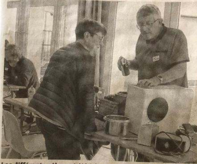
Les différents pôles ont été très visités.

Toute la journée de samedi, sous le préau de l'école, s'est déroulée une nouvelle édition du Repair Café. Cinquième du nom, ce Repair Café de la Vallée de la Weiss n'a pas désempilé, sur le thème « Jeter ? Pas question ! ». Pour mémoire, le Repair Café consiste à essayer de réparer - et apprendre comment réparer soi-même - gratuitement les objets cassés, plutôt que de les jeter. Une seule condition : il faut que les objets soient propres, transportables et ne pren-